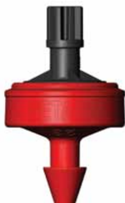
GOUTTEUR PCJ MODÈLE SORTIE CONIQUE