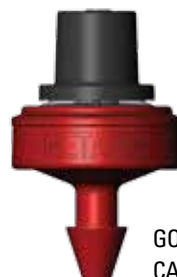
GOUTTEUR PCJ AVEC CAPUCHON À ASSEMBLÉ