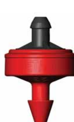
GOUTTEUR PCJ MODÈLE TÊTE DE VIPÈRE 3 MM